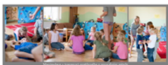
Motivace a trénink předvedení a pozdravů dětí