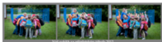
Naš poděk za pomocnou službu 2017